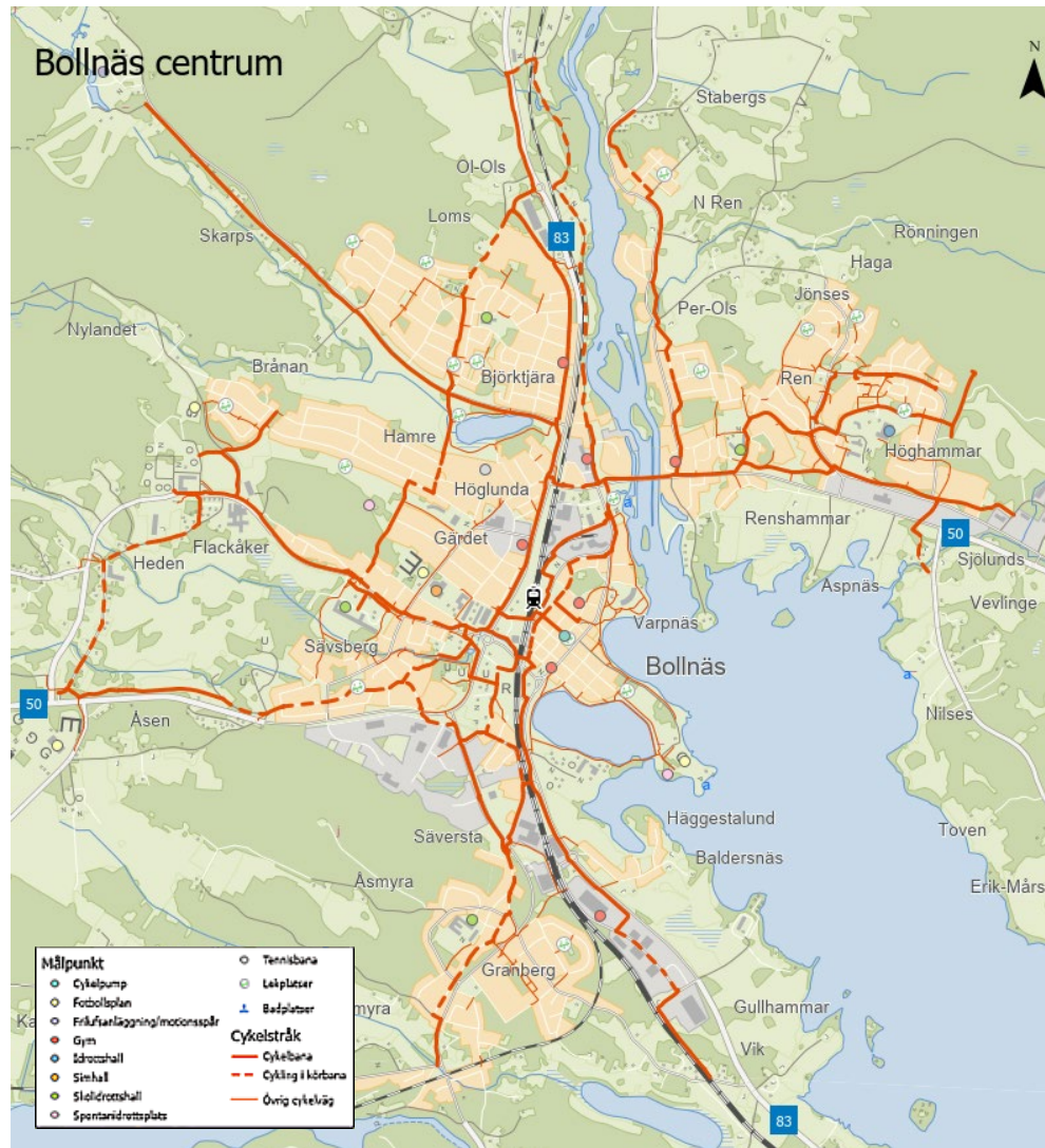
Lokalt cykelvägnät för Bollnäs tätort

Cykelvägnätet är centralt och grundläggande i cykelplanen. Utifrån följande nulägesbeskrivningen synliggörs vad kommunen kan utveckla när det gäller gång- och cykelvägnätet.