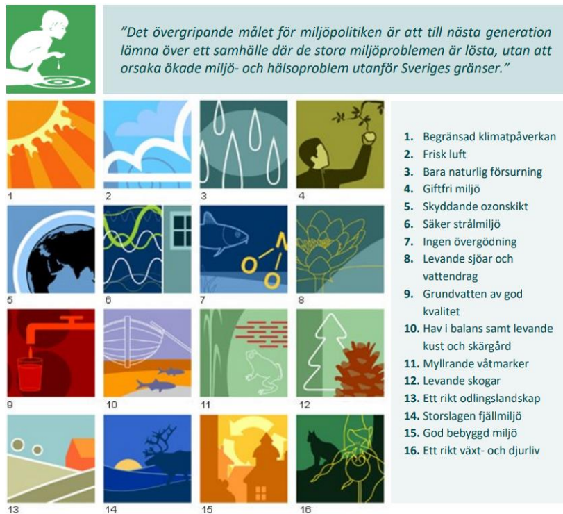
Figur 2: Generationsmålet och de 16 svenska miljö kvalitetsmålen