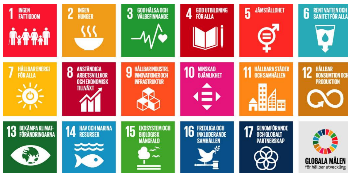
Figur 1 De 17 Globala målen

En hållbar utveckling kan beskrivas som en utveckling som tillfredsställer dagens behov utan att äventyra kommande generationers möjligheter att tillfredsställa sina behov. Hållbarhetsstrategin förenar Bollnäs kommuns program för social hållbarhet, Bollnäs kommuns program för ekologisk hållbarhet och Bollnäs kommuns kommande program för ekonomisk hållbarhet.