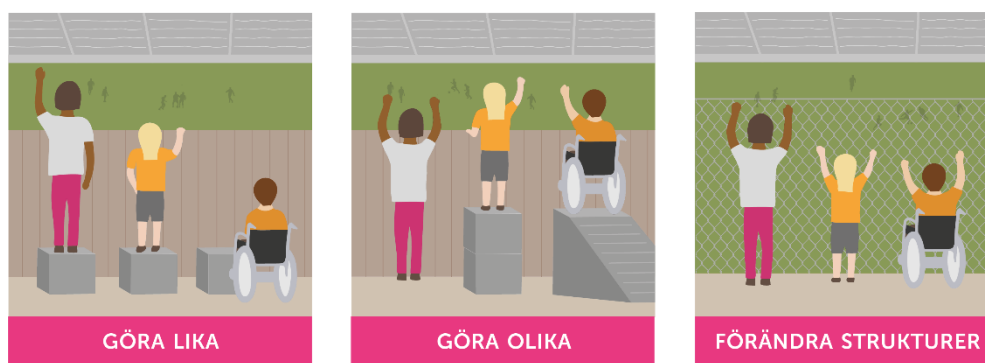
Figur 2 Att skapa jämlika möjligheter. Bild från Jämlikt Gävleborg. Rapport från Jämlikhetsutredningen. Region Gävleborg

Kommunstyrelsen har det kommunövergripande ansvaret för att samordna genomförande och uppföljning.