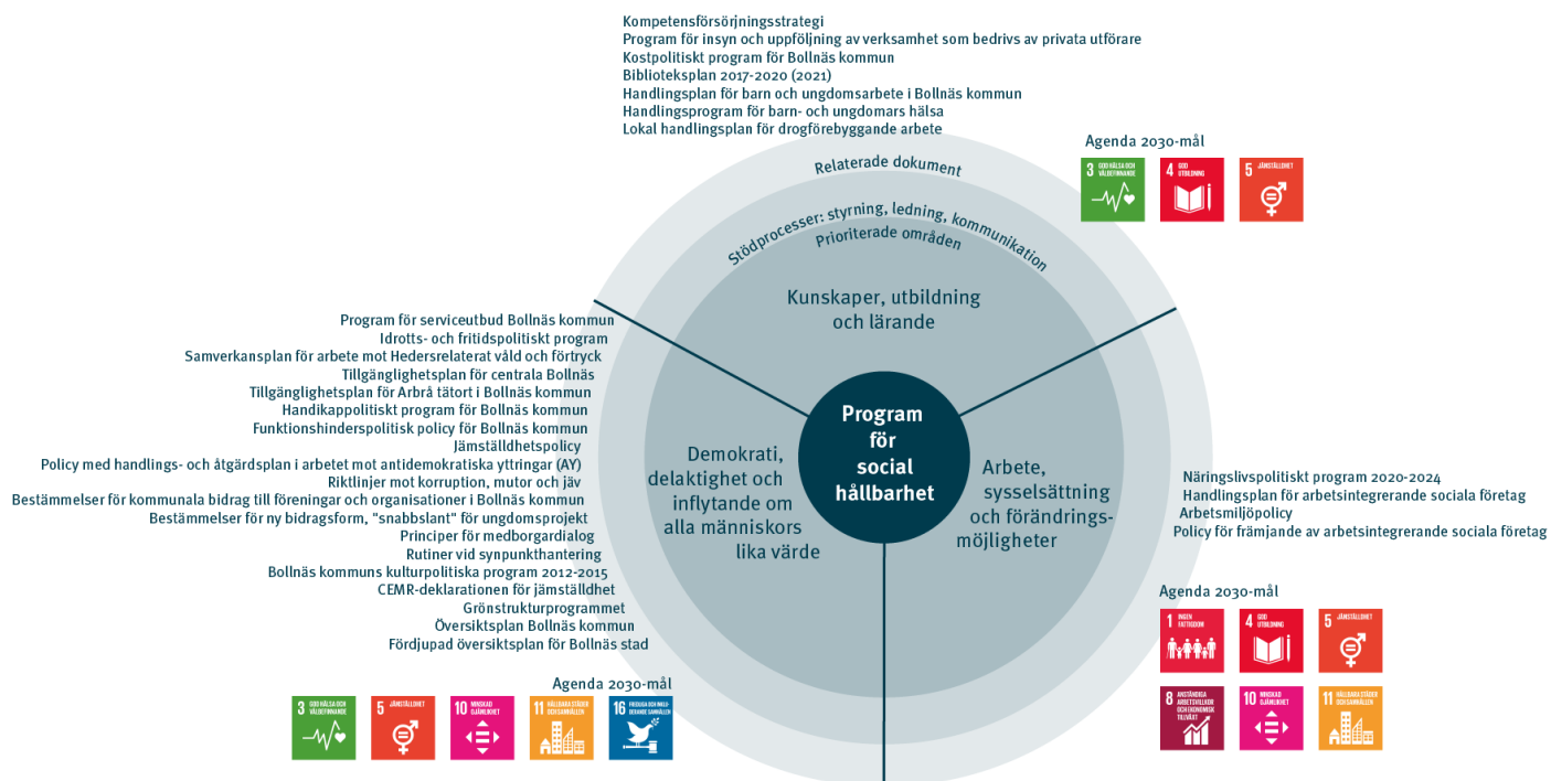
Figur 3 Programmet för social hållbarhets koppling till andra kommunala styrdokument och mål